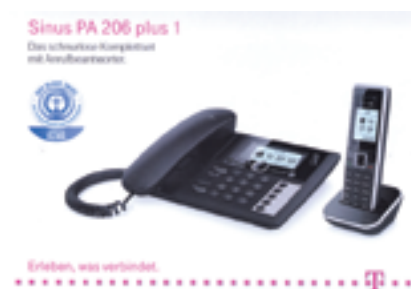
Abb. 1: Der Blaue Engel auf der Verpackung des Sinus PA 206 plus 1 (Telekom Deutschland GmbH) signalisiert „energieeffizient und strahlungsarm“

So denkt man nichtsahnend und den eigentlich vorbildlichen Produkten der Telekom positiv gewogen. Aber mit dem Sinus PA 206 plus 1 hat sich leider ein tiefschwarzes Schaf unter die Blauen Engel geschlichen.