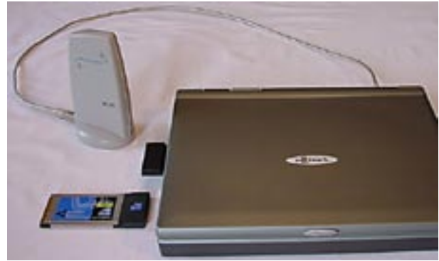
Abb. 3: Beispiele für WLAN PC-Cards (vorne links und seitlich im Notebook) sowie WLAN USB-Terminal-Adapter (hinten)

Neuere Notebooks sind zumeist schon mit einem WLAN-Modul „on board“, d.h. als fester Bestandteil auf der Hauptplatine, ausgerüstet (z.B. Centrino-Technologie).