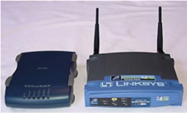
Abb. 2: Beispiele für WLAN Access Points