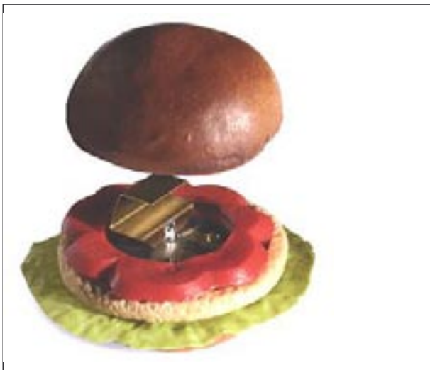
Abb. 4: Beispiel für eine der Umgebung angepasste WLAN-Antenne im Fast Food-Restaurant

WLANs sind mittlerweile an einer ganzen Reihe von so genannten Hot Spots installiert, also Orten, an denen sich viele Menschen aufhalten – die ihr Notebook oder ihren Organizer bzw. Palmtop mitgebracht haben – und von denen man vermutet, dass sie dort ein dringendes Bedürfnis nach Surfen im Internet und dem Versenden und Empfangen von Emails haben. Dies sind vorzugsweise Warteräume in Flughäfen und Hotels, Cafés und Restaurants an zentralen Plätzen oder ganze Universitätsgelände.